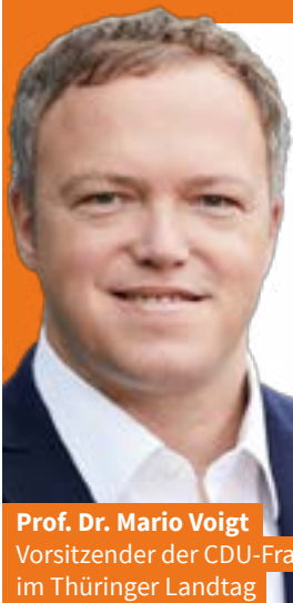
Prof. Dr. Mario Voigt Vorsitzender der CDU-Fraktion im Thüringer Landtag

Liebe Leserinnen, liebe Leser, vor uns liegt kein Sommer wie jeder andere. Die Coronakrise hat 2020 verändert. Deutschland ist dabei so gut durch die Pandemie gekommen wie kein anderes Land. Schauen wir auf die USA, Brasilien oder Italien, können wir froh sein, in unserer Heimat zu leben. Wir haben das