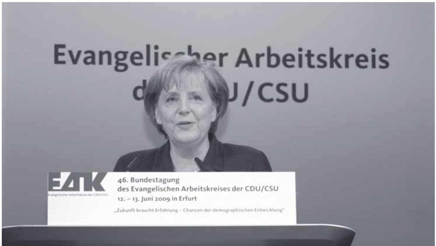
Verdeutlichte die hohen Chancen der demographischen Entwicklung: Bundeskanzlerin Dr. Angela Merkel MdB

Revolution in der früheren DDR und den gesamten osteuropäischen Staaten.“ Auch Angela Merkel betonte, dass die DDR ein Unrechtsstaat war – und dies zeige, „dass Freiheit ein Gut ist, das nicht selbstverständlich ist, sondern das immer wieder erarbeitet und erworben werden muss.“