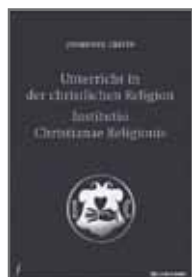
Johannes Calvin, Unterricht in der christlichen Religion – Institutio Christianae Religionis Neukirchener Verlag, Neukirchen-Vluyn 2008 ISBN 978-3-7887-2327-9 gebunden, 860 Seiten, 49,90 EUR