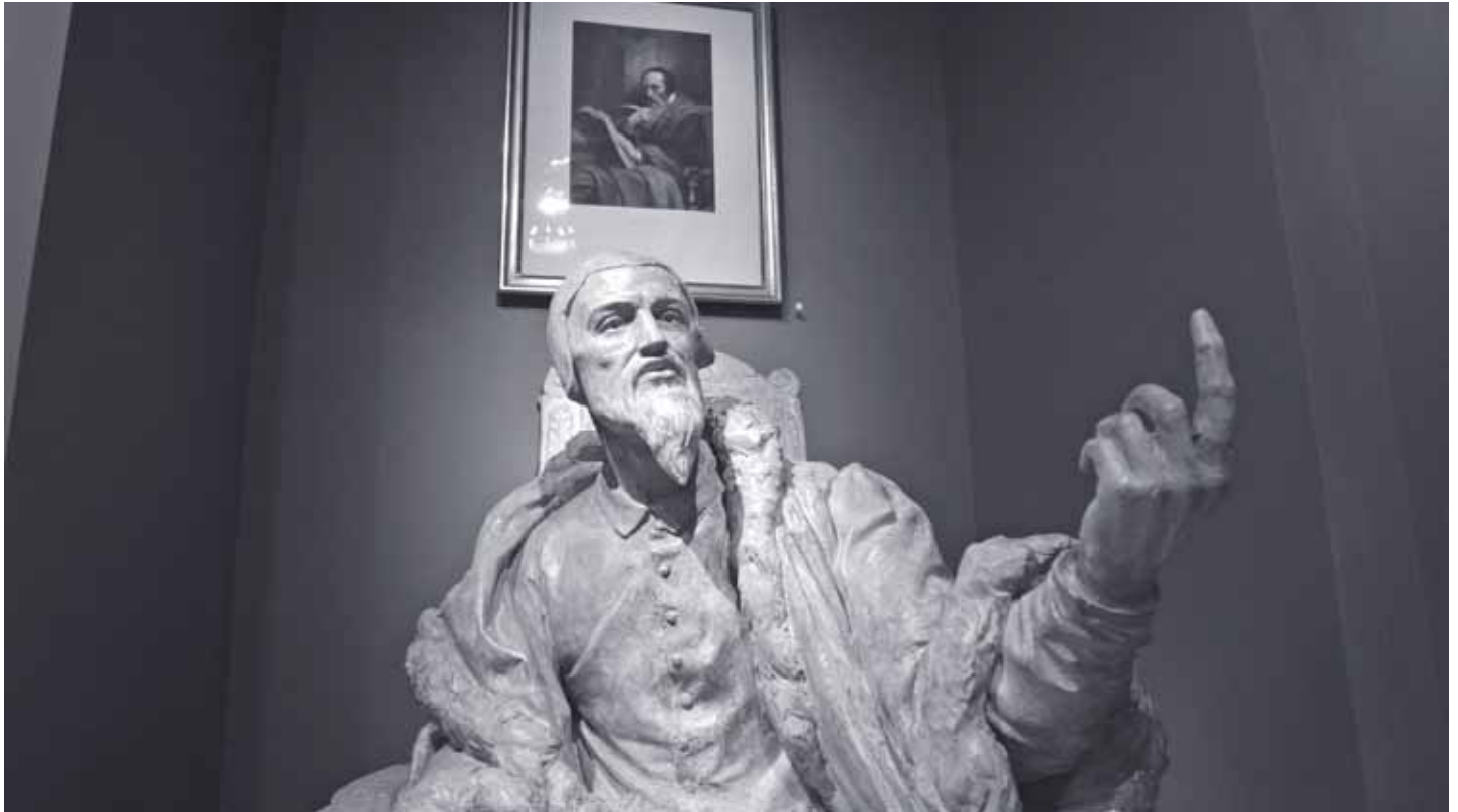
Calvin-Statue im Reformationsmuseum in Genf