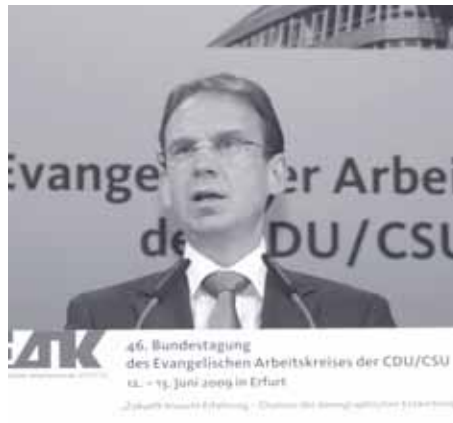
Blickt optimistisch in die Zukunft Deutschlands und Thüringens: Ministerpräsident Dieter Althaus MdL.